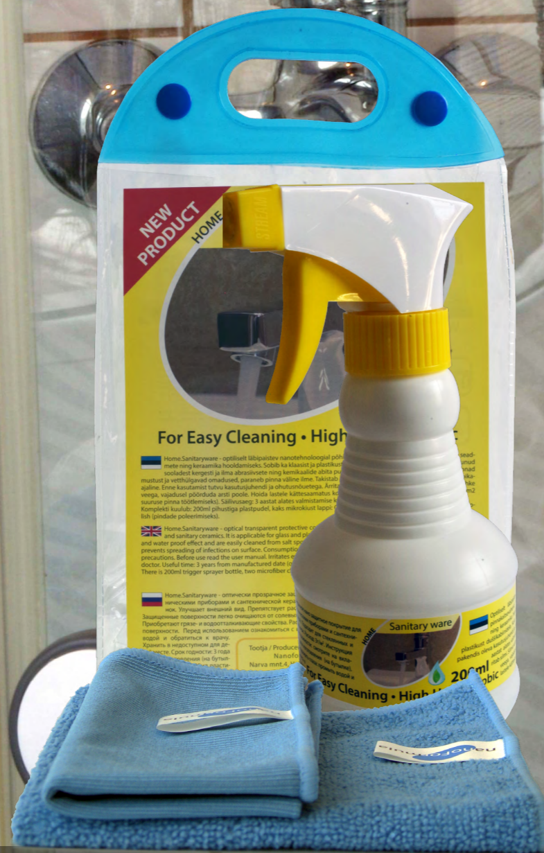
Home.Sanitaryware комплект, 200 мл