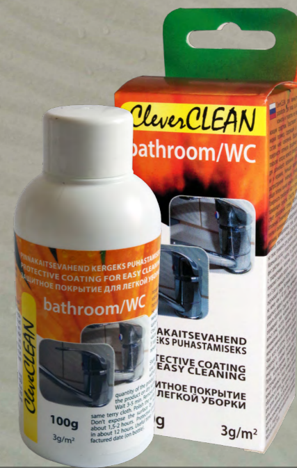
CleverCLEAN для ванной/туалета, 100г